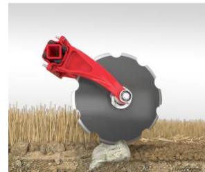
Nonstop ochrana proti kamenům S gumovými prvky Bezúdržbová ložiska a náboje s kovanými ložisky